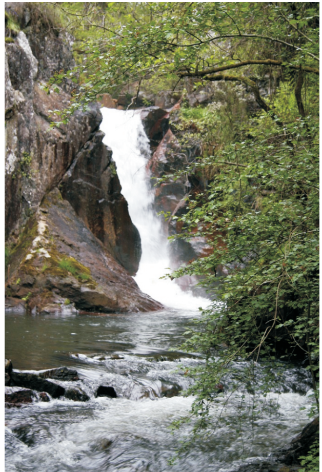
Salto das Pombas